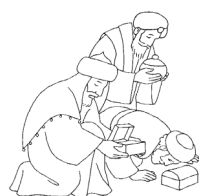
Epiphanie du Seigneur 4 janvier

Le dimanche 29 novembre sera le premier dimanche de l'Avent de notre Seigneur Jésus Christ, à qui soient l'honneur et la gloire, pour les siècles des siècles. Amen.