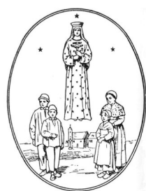
Notre-Dame de Pontmain

Vendredi 23, à 20h, Chapelle Saint-Jacques, Célébration œcuménique, Avenue d'Italie