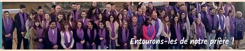
Entourons-les de notre prière !

catéchumènes ont vécu l'Appel décisif à la cathédrale, le 22 février