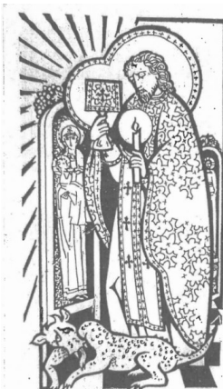
Saint Josaphat 12 novembre