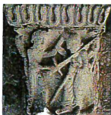
Saint Maurin 25 novembre